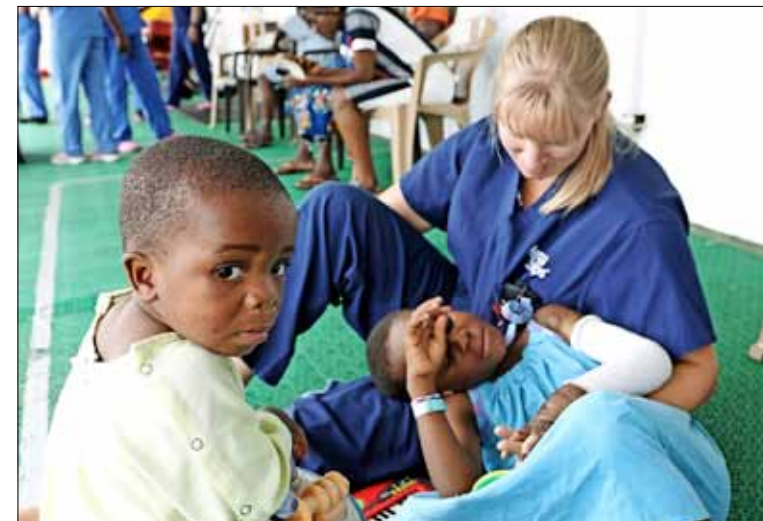
Op dek 7 aan boord van de Africa Mercy vervagen de grenzen tussen verpleegkundigen en patiënten.