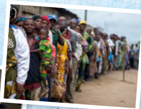
Patiëntenscreenings in de havenstad Cotonou.