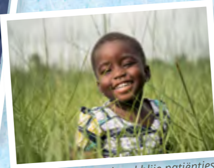
...en vooral heel veel blij patiëntjes.