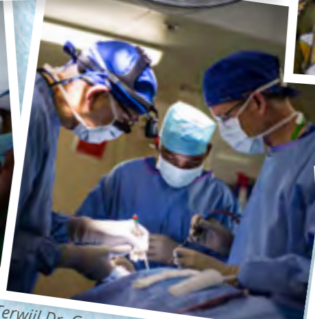
Terwijl Dr. Gary en Dr. Kyle kleine Israël opereren, vormen ze de lokale chirurgen.