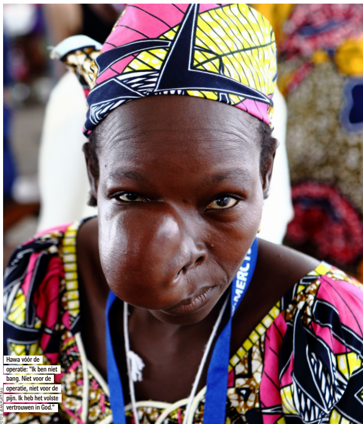
Hawa vóór de operatie. "Ik ben niet bang. Niet voor de operatie, niet voor de pijn. Ik heb het volste vertrouwen in God."

Een onbehaaglijk gevoel bekruipt me. Deze vrouw heeft een joekel van een tumor op haar gezicht, en toch lacht ze naar me. "Ze is er gewend aan geraakt, en veel mensen in haar dorp hebben hetzelfde probleem", zegt Ga-