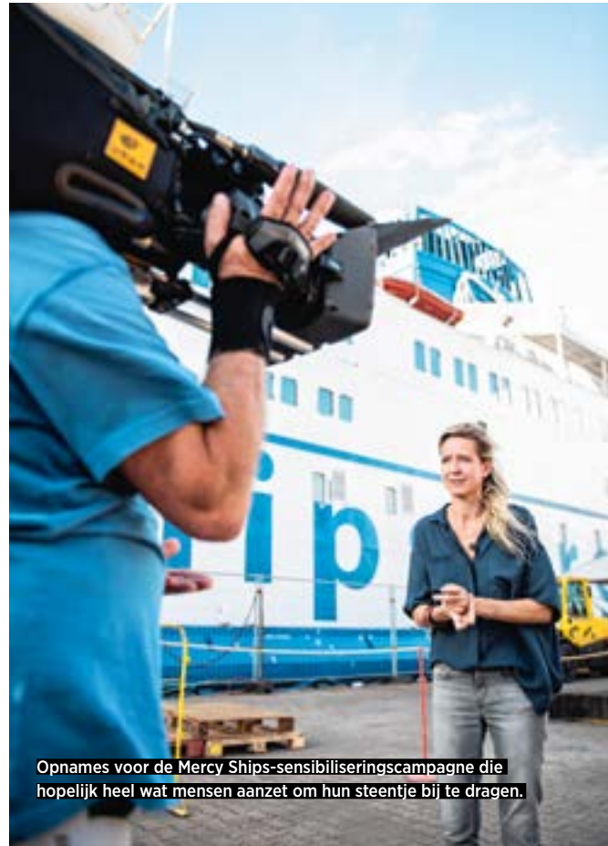
Opnames voor de Mercy Ships-sensibiliseringscampagne die hopelijk heel wat mensen aanzet om hun steentje bij te dragen.